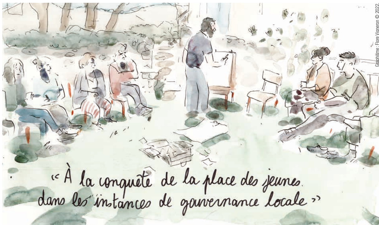
Graphisme : Flore Vignerot © 2022.

« À la conquête de la place des jeunes dans les instances de gouvernance locale »